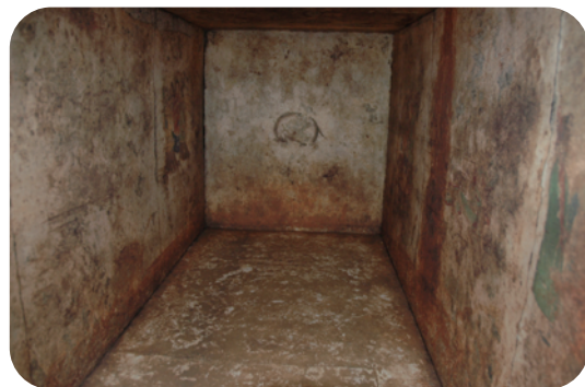
高松塚古墳石室内部