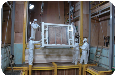
高松塚古墳石室解体の様子